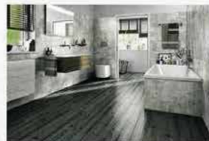
„Neo Vario“, die alternative Wand- und Bodenfliese, Wand: „45852 Vanity“, Boden: „47500 Lärche“